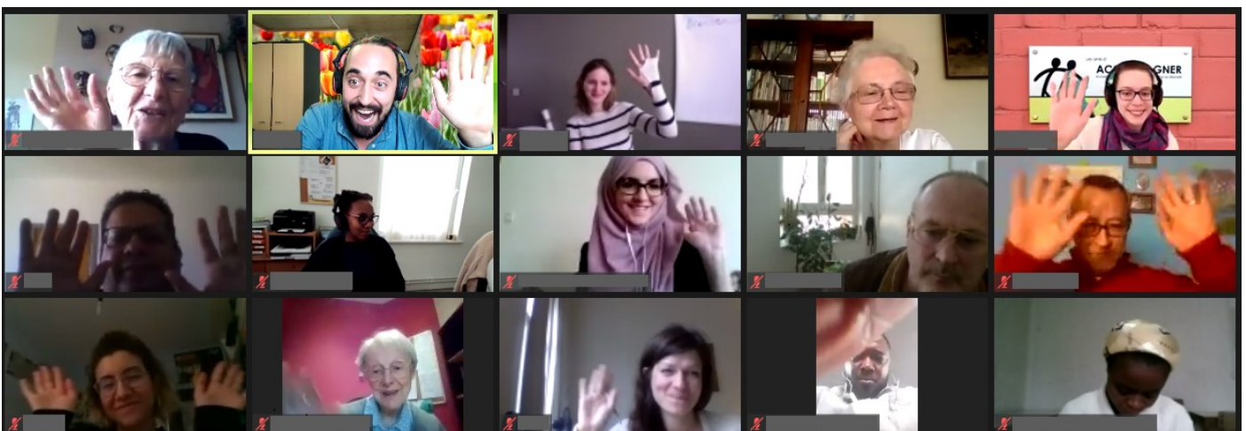
Onze vrijwilligers in videoconferentie